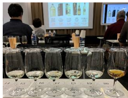
News③ 酒類関連のテイ スティング講習会に参加