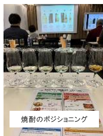
焼酎のポジション

唎酒師(ききざけし)として登録しているSSIのテーマ別のテイスティング講座「米の品種別の違いをワインと比較しながら探る」を受講してきました。当日は、焼酎も加わり、ワイン、日本酒を多様にテイスティングした貴重な体験でした。