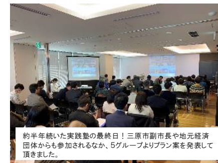
約半年続いた実践塾の最終日！三原市副市長や地元経済団体からも参加されるなか、5グループよりプラン案を発表して頂きました。