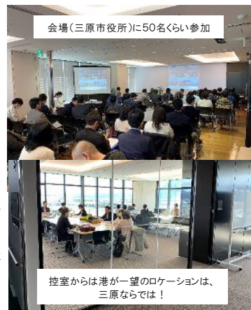
会場(三原市役所)に50名くらい参加

これから各プラン案から、より具体的に進展してくるでしょう。空き家対策の事業など各地で行われていますが、実践塾のテーマのように、「物件の魅力×地域の魅力」を活かしたプランで、地域の皆様も自然にも協力して頂けるような流れもポイントだと考えます。