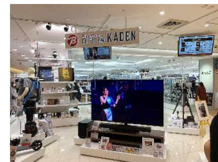
News④ 三越・日本橋本店に オープンしたビックカメラ視察

家電量販店のビックカメラがオープン。百貨店業界のビジネスモデルも変化した様子を拝見。